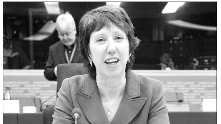
Catherine Ashton, commissaire européenne au Commerce

Le lancement de consultations constitue la première étape du processus de règlement des différends à l'OMC. Cette étape peut durer jusqu'à soixante jours, avant la mise en place d'un groupe spécial chargé d'examiner la plainte déposée, si les consultations n'ont pas permis de trouver une solution. Après avoir bénéficié pendant quelques années d'une période de grâce pour s'adapter aux règles de l'OMC, la Chine, qui y a adhéré en 2001, a vu les plaintes s'accumuler